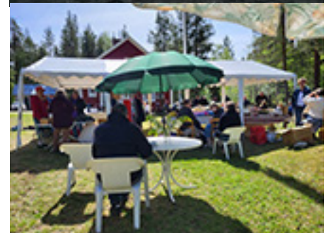
Arrangemang på bygårdens