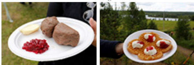
Serveras under Åträskdagen