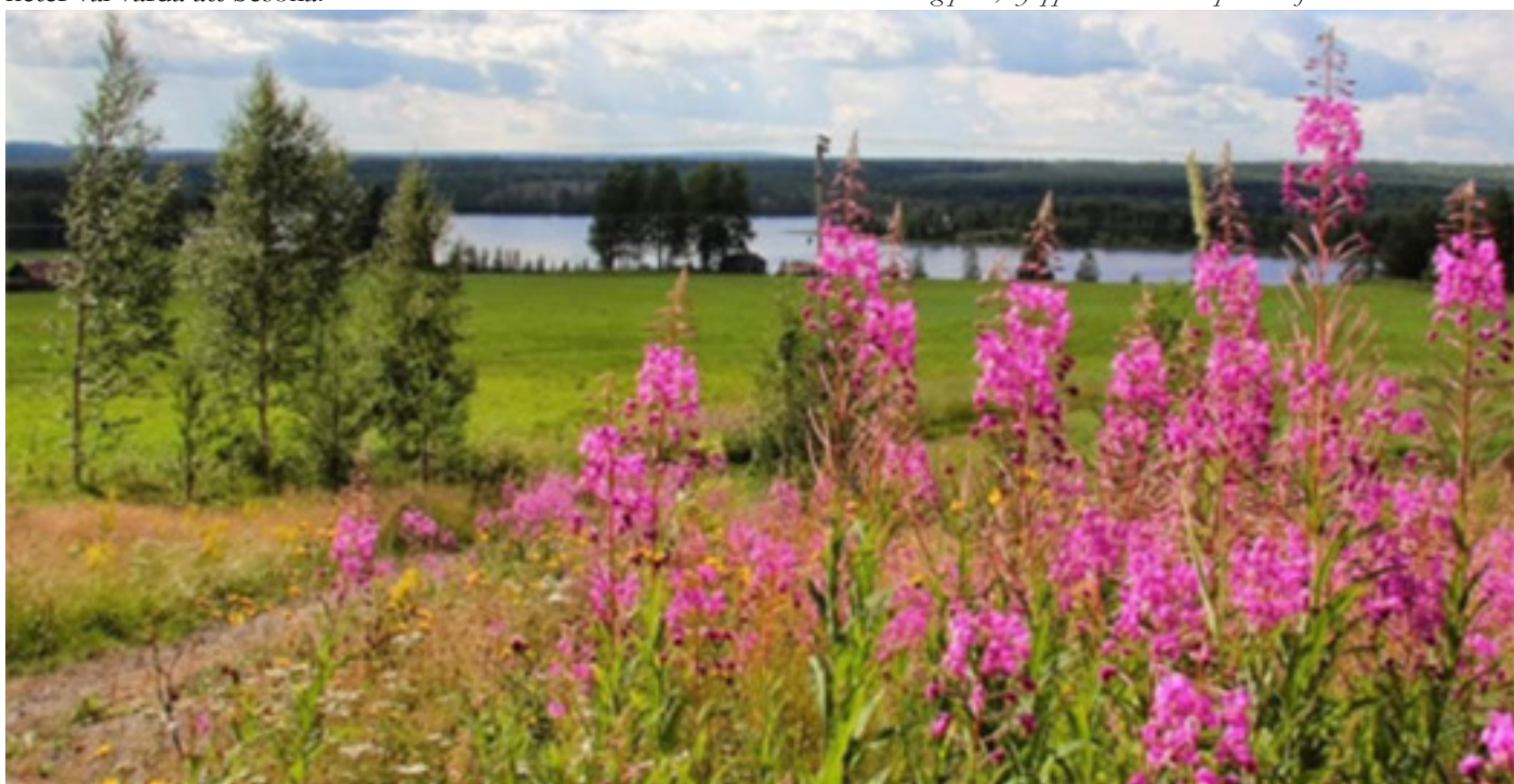
Utsikt från bygården ut över sjön.