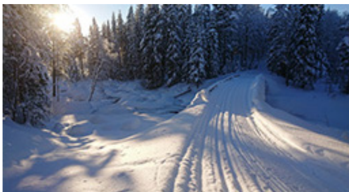
Skidspår och skoterspår kring byn, just här över Sågforsbron i vinterskrud.