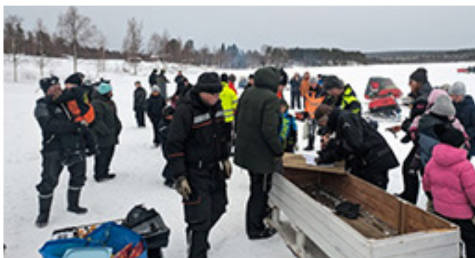
Samarrangemang med grannbyn Yttersta, loppis och pimpeltävling.