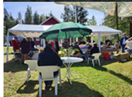
Arrangemang på bygårdens