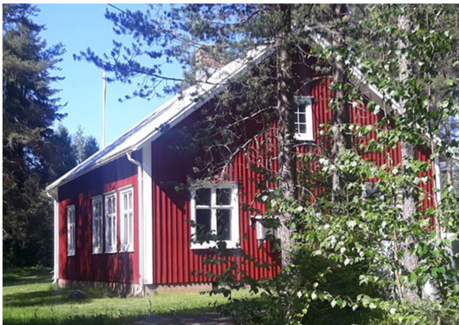
Yttersta hembygdsgård i sommarprakt.