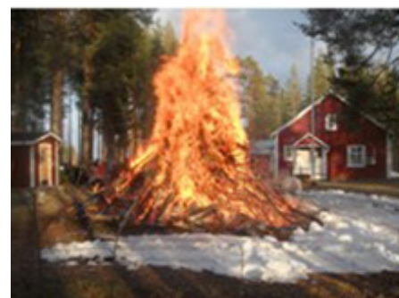
Valborg i Yttersta