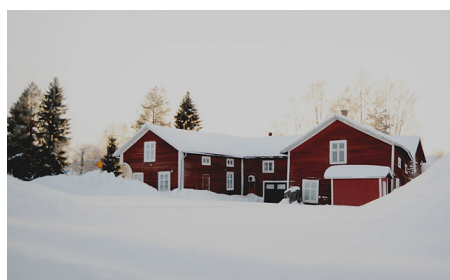
Garveriet i Sjulnäs

Det är Landsbygdspolitiska rådet som utser årets by. Årets by får förutom äran 15 000 kronor och "Årets By"-skyltar som är ett vandringspris mellan segrande byar.