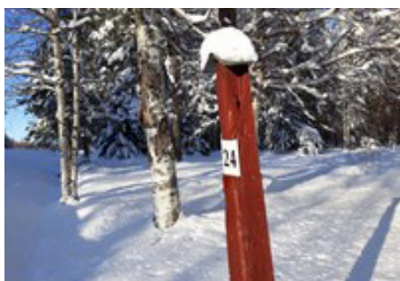
Kilometerstolpe av trä i Yttersta, 24 km till sockenkyrkan i Öjebyn.

Här kan du också hitta den vita blåklockan