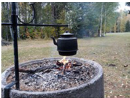
Kaffe över en stilla eld skapar lugn och harmoni – en lisa för själen.